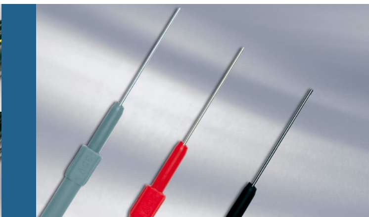
Набор измерительных наконечников