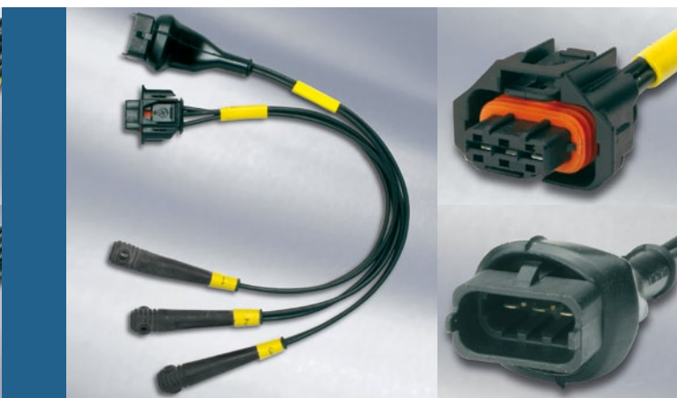
Универсальный адаптер 1 684 463 447, 3 контакта