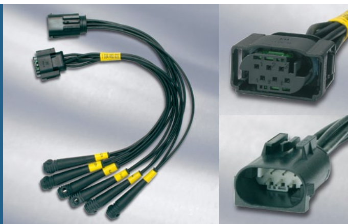
Универсальный адаптер 1 684 463 479, 6 контактов