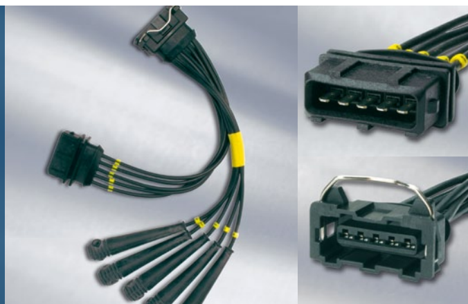
Универсальный адаптер 1 684 463 344, 5 контактов