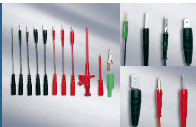
Набор проверочных кабелей