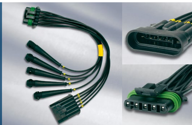
Универсальный адаптер 1 684 463 382, 5 контактов