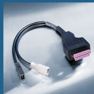
VW/Audi 1 684 463 611