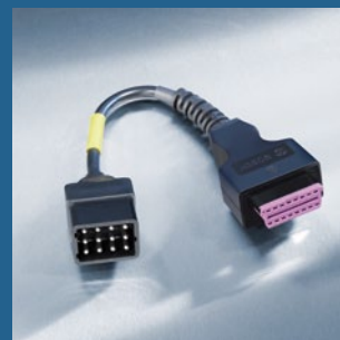
Renault легк. 12-pin 1 684 465 582