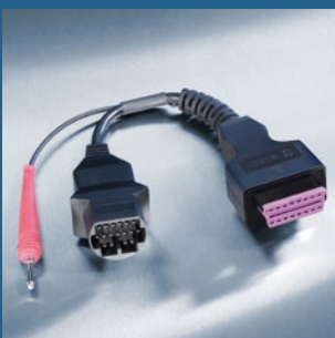
Toyota 17-pin 1 684 463 642