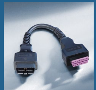
Toyota без pin 1 & 9 1 684 463 686