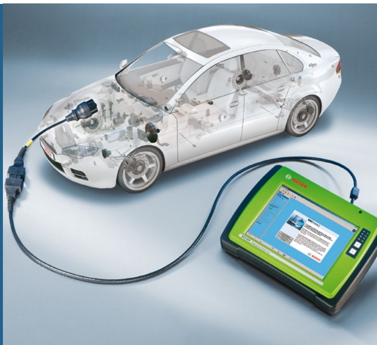
Программное обеспечение ESI[tronic], управляющее сканерами KTS, автоматически и безошибочно распознает кабели "Easy Connect"