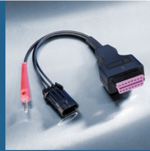
Группа Fiat 3-pin 1 684 463 613