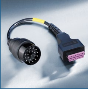
BMW 20-pin 1 684 463 631