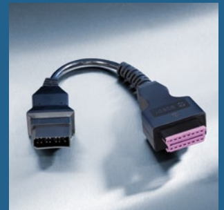
Nissan 14-pin 1 684 463 639