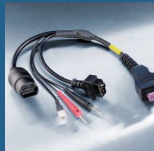
Mazda 25-pin 1 684 463 637