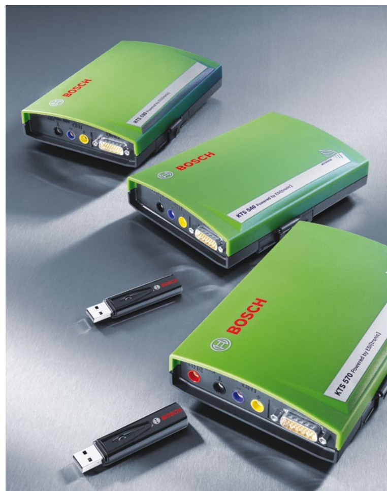
KTS 570, KTS 540 с USB-адаптером Bluetooth и KTS 530