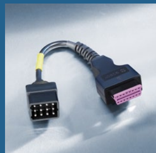
Renault груз. 12-pin 1 684 465 581