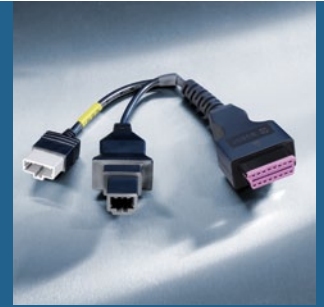
Honda 3- и 5-pin 1 684 463 634