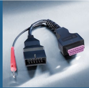
Daewoo/GM/Holden 12-pin 1 684 463 632