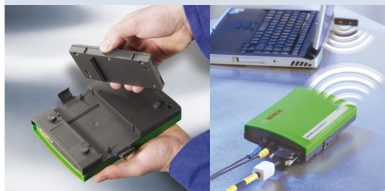
Всегда актуален благодаря встроенному сменному OBD-коммутатору