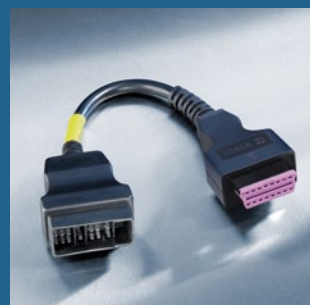
Toyota 23-pin 1 684 463 643