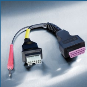
Hyundai/Mitsubishi 12-pin 1 684 463 638