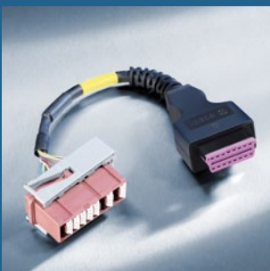
Peugeot 30-pin (PSA 30) 1 684 465 583